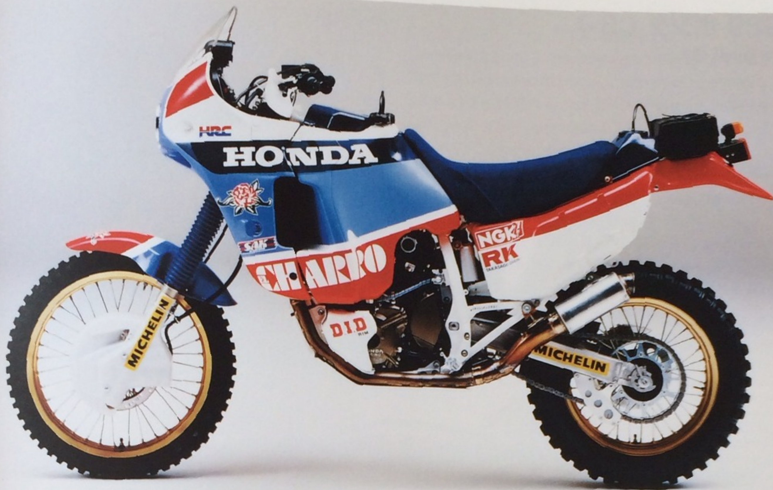
※写真は 1986 年の NXR レーサー "Photo above 1986 NXR Racer"

「ボディサイドにも記されている“Africa Twin”という名前ですが、ヨーロッパの営業の方が“アフリカまで走るV2気筒、ならばアフリカツインだね”ということで決まりました。トランザルプ、単気筒のドミネーター、そしてアフリカツインと、狙い通り欧州のオン・オフ市場にキャラクターの異なる3タイプの個性を投入することができました。ユーザーが欲しいもの、それは造り手が欲しい物と同じだ、という思いで仕上げました。そのコンセプトが明快に伝わったのだと思います。アフリカツインはオン・オフのレーサーレプリカとして、生まれるべくして生まれたのです」