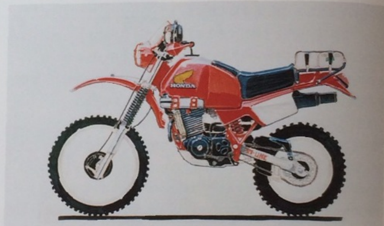
※上4点は、XL600R バリダカのデザイン画。 *4 sketches above XL600R Paris-Dakar.